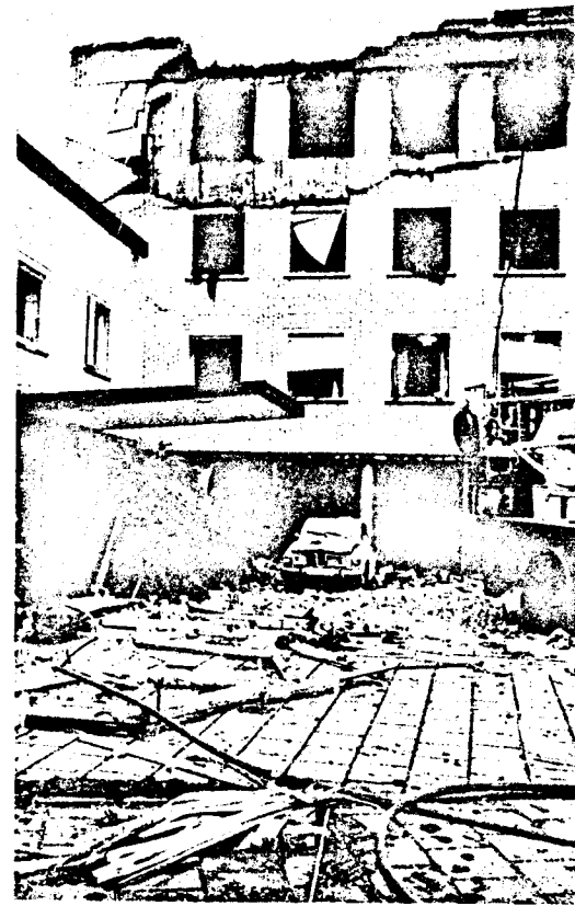
Stockholm-Botschaft nach dem Attentat Zweimal Lebenslang und eine Taktik ...

Von Lückenlosigkeit der Isolation keine Spur, und der Vorsitzende insistiert auch keineswegs — ganz im Gegenteil. Müller, im Anschluß an die Urteilsbegründung: „Diese Möglichkeit zum gemeinsamen Umschluß fällt ja nun nach Abschluß der Hauptverhand-