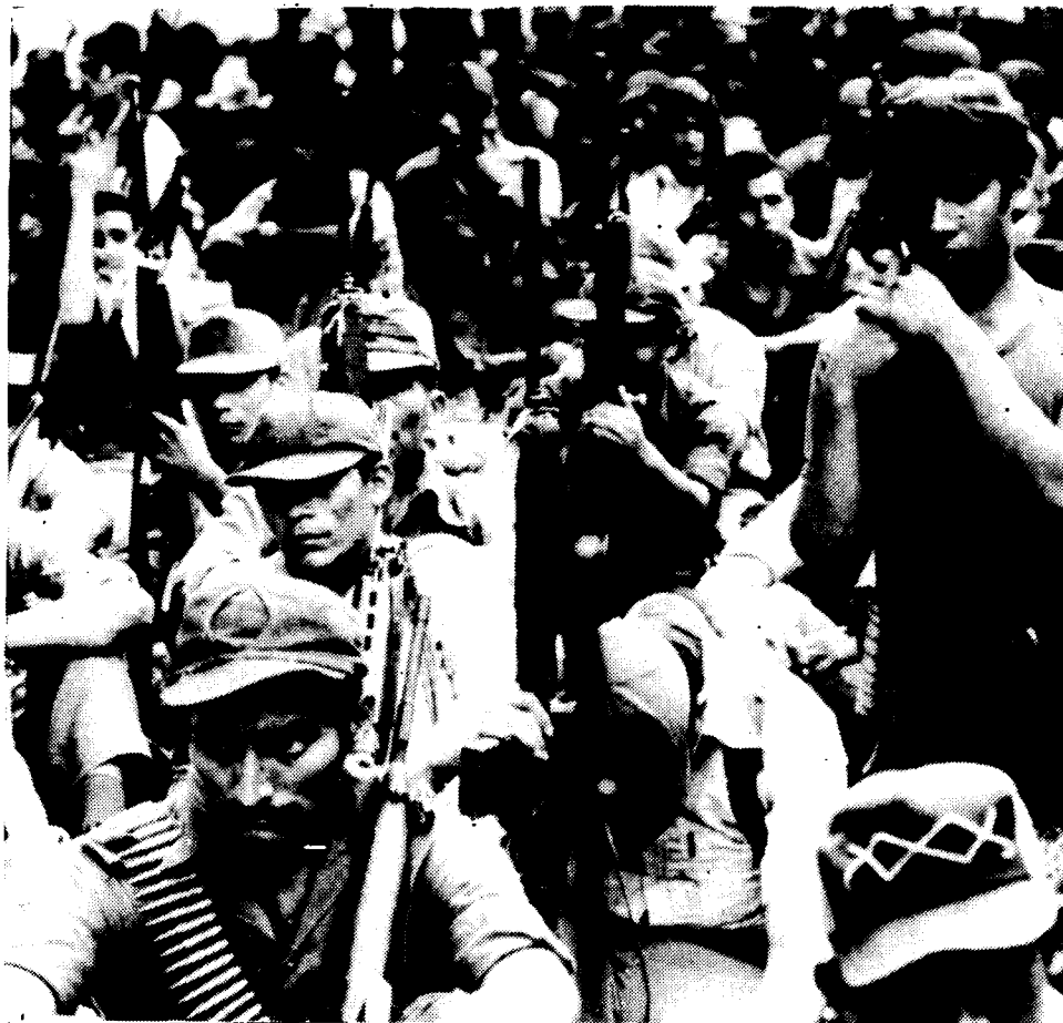
Es gibt keine Drohung, die uns aufhalten kann.

In Nicaragua haben die Israelis auch eine besondere Rolle gespielt. Sie haben sich an dem Aufbau und der Aufrüstung