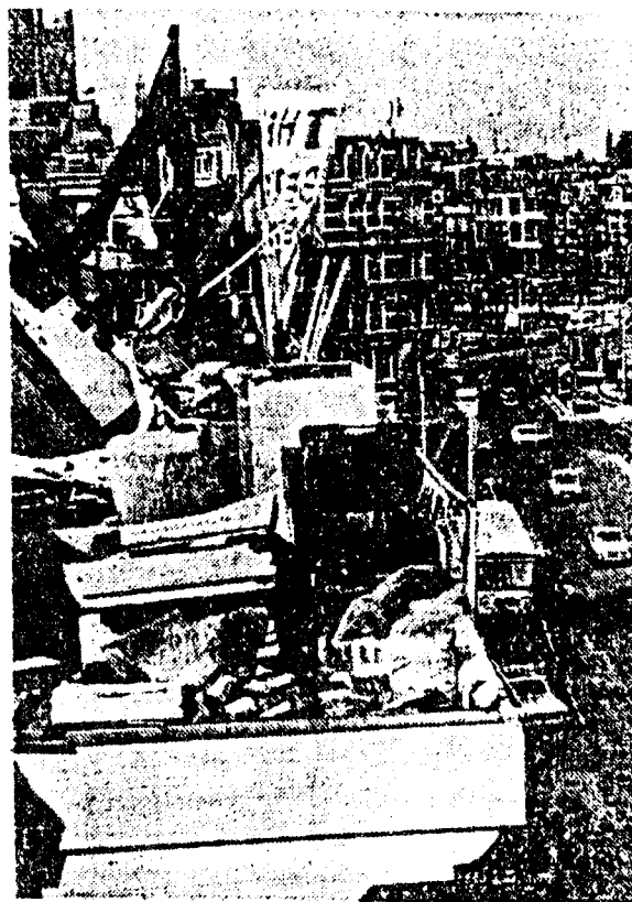
P.H. kade aug. '80